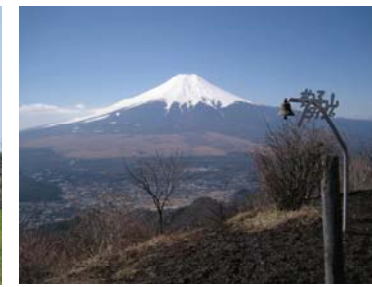
・杓子山からの富士山の眺望