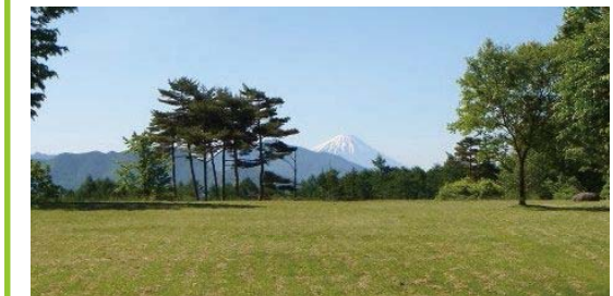
・平坦で広々とした芝生広場