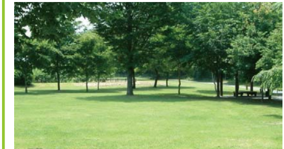
・緑陰と緩やかな起伏のある芝生広場