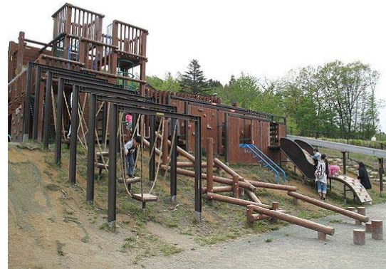
・傾斜地を利用したコンビネーション遊具