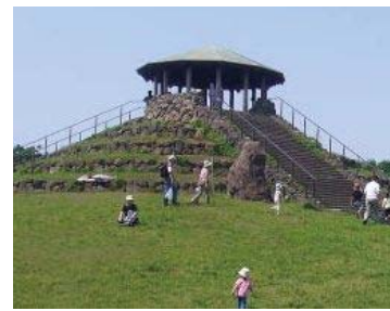
・休憩所兼展望台のイメージ