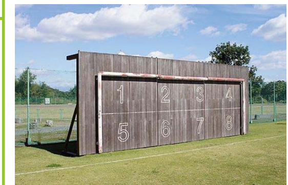
・ボール当てウォール