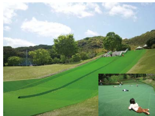
・芝生広場側の斜面を利用した芝滑り