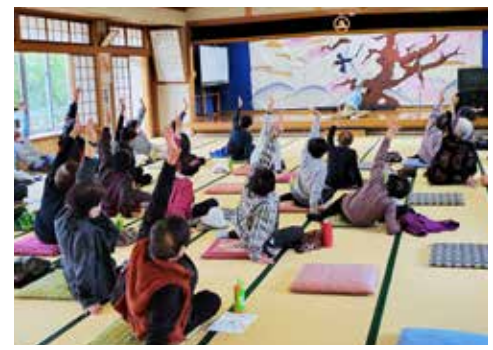
感染予防に気をつけて開催しているにこにこ教室